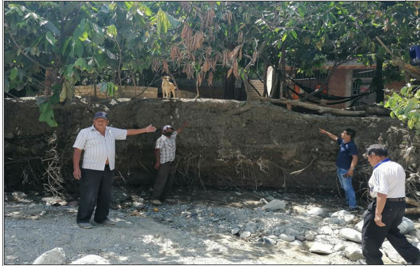
Fotografía N° 08: Vista actual de un hundimiento en la zona adyacente.