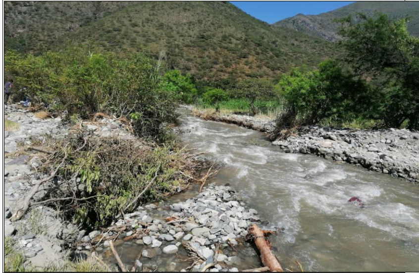
Fotografía N°04: Vista actual de colmatado en Quebrada Manta (aguas arriba).